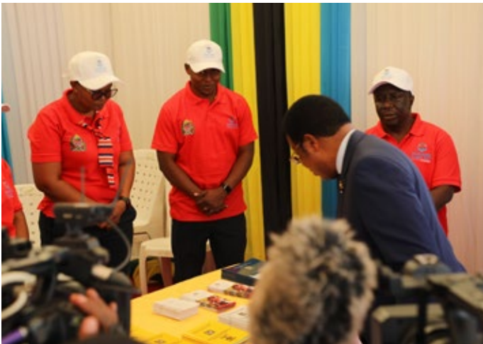
Waziri Mkuu Mhe. Kassim Majaliwa akitia Saini kitabu cha wageni wa Wizara ya Katiba na Sheria alipowasili kwenye viwanja vya ukumbi wa Chuo Kikuu cha Dodoma kuzindua Kampeni ya Msaada wa Kisheria ya Mama Samia (Mama Samia Legal Aid Campaign), Aprili 27, 2023.

Amesema kuwa kampeni hiyo itatekelezwa pande zote mbili za Muungano kwa kushirikiana na wadau mbalimbali wa Serikali na wasio wa serikali ikiwemo Ofisi ya Mashtaka, Mwanasheria Mkuu wa Serikali, Ustawi wa Jamii, vyuo vya elimu ya juu, Wengine ni CHAMA cha Wanasheria nchini (TLS), Mtandao wa Mashirika yanayotoa huduma ya msaada wa kisheria – (TANLAP), Taasisi ya Huduma za Kisheria (LSF), LHRC, EU, UNDP, WILDAF na Benki ya NMB