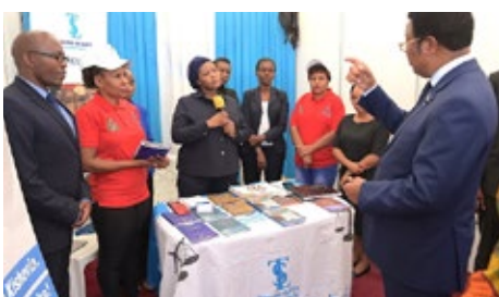
Waziri Mkuu Kassim Majaliwa akizungumza na viongozi na wananchama wa Tanganyika Law Society wakati alipotembelea banda laa kabla ya kuzindua Kampeni ya Msaada wa Kisheria ya Mama Samia (Mama Samia Legal Aid Campaign) kwenye ukumbi wa Chuo Kikuu cha Dodoma, Aprili 27, 2023.