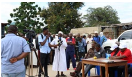
Mwananchi wa Wilaya ya Kondoa akimweleza Waziri wa Katiba na Sheria Dkt. Damas Ndumbaro mgogoro wa ardhini baada ya Waziri Ndumbaro kufanya ziara ya kukagua maendeleo ya Mama Samia legal aid Campaign katika wilaya ya Kondoa tarehe 6 mei 2023 jijini Dodoma.