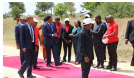
Waziri Mkuu Mhe. Kassim Majaliwa akisalimiana na viongozi wa wizara na mkoa wakati alipowasilii kwenye viwanja vya ukumbi wa Chuo Kikuu cha Dodoma kuzindua Kampeni ya Msaada wa Kisheria ya Mama Samia (Mama Samia Legal Aid Campaign), Aprili 27, 2023.