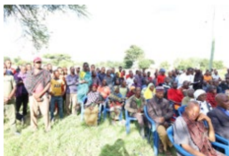
Wananchi wa kijiji cha Kidoka Kata ya Kidoka Wilayani chemba wakimsikiliza Waziri wa Katiba na Sheria (hayupo pichani) alipokuwa akitoa ufafanuzi wa umuhimu wa mama Samia Legal Aid Campaign tarehe 6 mei 2023 chemba jijini Dodoma.