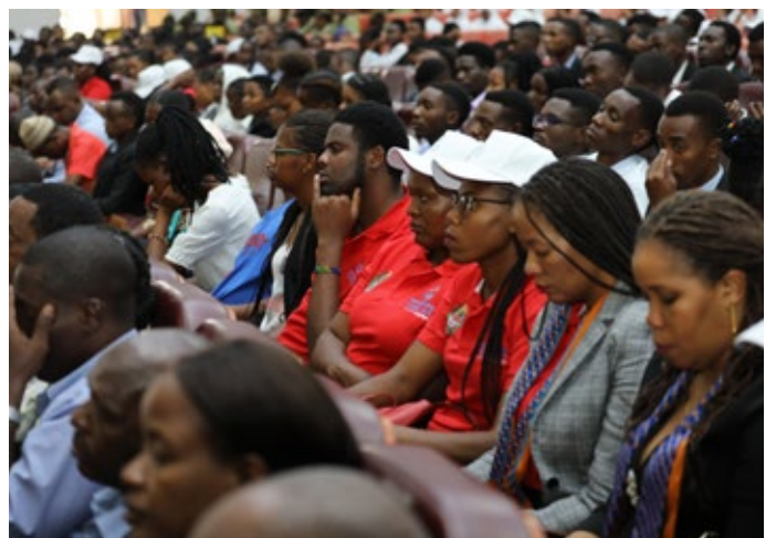
Baadhi ya wananchi waliofika kushuhudia uzinduzi wa kampeni hiyo wakifuatilia kwa makini hotuba ya Mgeni Rasmi Waziri Mkuu, Mhe. Kassim Majaliwa.