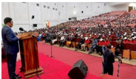
Waziri Mkuu wa Serikali ya Jamhuri ya Muungano wa Tanzania Mhe. Kassim Majaliwa akihitubia kabla ya kuzindua rasmi kampeni ya msaada wa kisheria inayoitwa Mama Samia Legal Aid Campaign kwa mkoa wa Dodoma Aprili 27, 2023.