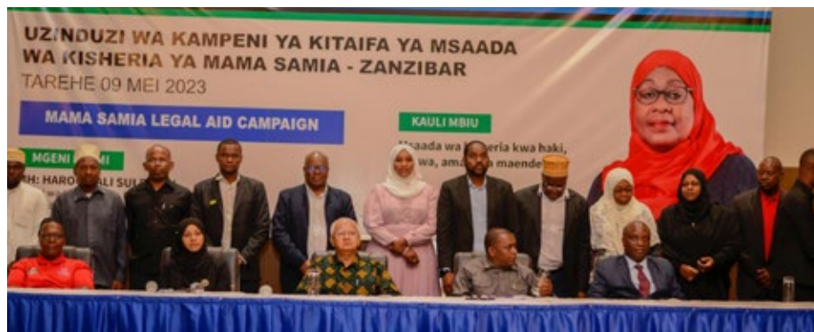
Viongozi wa wadau mbalimbali wakiwa katika picha ya pamoja mara baada ya uzinduzi wa Mama Samia Legal Aid Campaign Zanzibar.