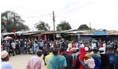
Wananchi wa Wilaya ya Kondoa wakikiwa wamejitokeza kwenye viwanja vya soko kuu kumsikiliza Waziri wa Katiba na Sheria Dkt Damas Ndumbaro alipokuwa alipokuwa akitoa ufafanuzi kuhusu Mama Samia Legal Aid Campaign tarehe 6 mei 2023 jijini Dodoma.