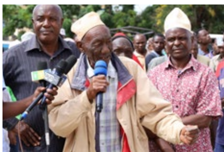
Mkazi wa Wilaya ya Kondo akimweleza jambo Waziri wa Katiba na Sheria Dkt. Damas Ndumbaro (hayupo pichani) Baada ya Waziri Ndumbaro kufanya ziara ya kukagua maendeleo ya Mama Samia legal aid Campaign katika Wilaya ya Kondo tarehe 6 mei 2023 jijini Dodoma.

Kampenzi hii katika mkoa wa Dodoma ilizinduliwa na Waziri Mkuu wa Jamuhuri ya Muungano wa Tanzania Mhe. Kassim Majaliwa Majaliwa (Mb) Aprili 27 jijini Dodoma ambapo ndani ya siku sita tangu kuanza Kampani hiyo, wananchi wa kata 10 za Wilaya ya Chemba wamefikwa na huduma hii ambapo kwa Wilaya ya Kondo wananchi zaidi ya 5,000 wamepata elimu na wengine kupewa msaada wa kisheria.