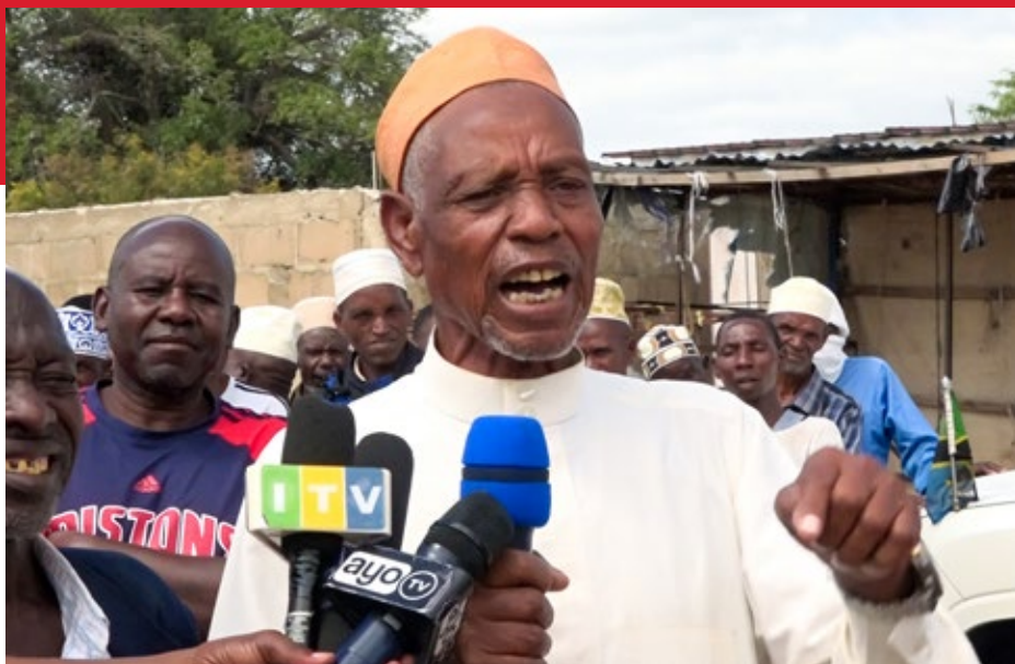
Waziri wa Katiba na Sheria Mhe Dkt Damas Ndumbaro akiongea na Jukwaa la Wakurugenzi Wanawake waliowakilisha mashirika takribani 400 yanayotetea haki za wanawake, wasichana na watoto nchini Tanzania (hawapo pichani) walipontembelea ofisini kwake April 5, 2023.