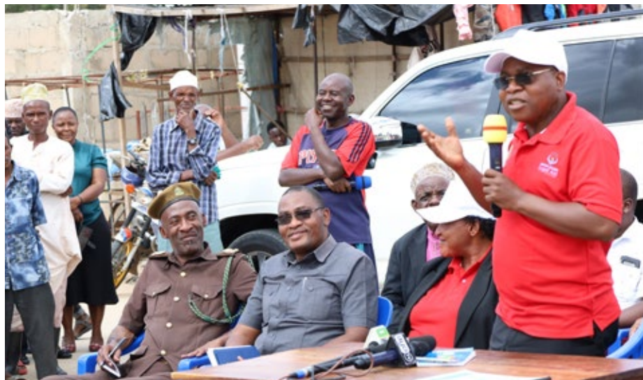
Waziri wa Katiba na Sheria Dkt Damas Ndumbaro akitoa ufafanuzi kwa wananchi wa Kondo baada ya kupokea kero zao za migogoro mbalimbali alipokwenda kukagua menedelea ya Kampani ya Mama Samia Legal Aid tarehe 06 mei 2023 kondo jiji Dodoma.

“Kwa watu niliowasikiliza inaonekana migogoro ya ardhi ni changamoto kubwa hapa, inaonekana tatizo kubwa ni ofisi ya ardhi katika halmashauri, mimi niwaahidi kuwa tutaleta timu maalumu wiki ijayo ije ipitie changamoto hizi na zingine ambazo hazijasemwa. Kama mwananchi ametoa eneo kwa ajili ya maendeleo na si kuchukuliwa na