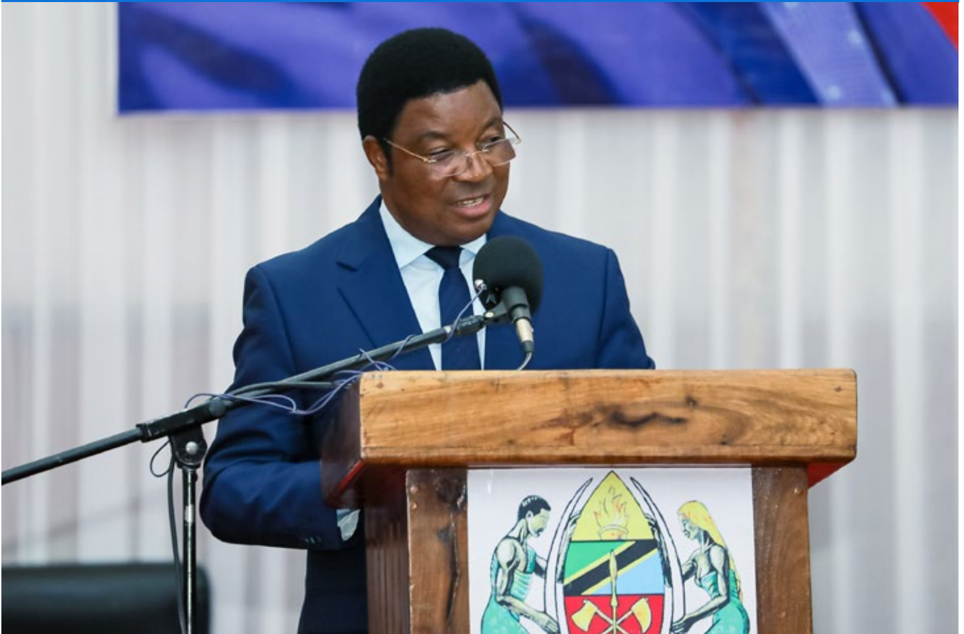
Waziri Mkuu, Mhe. Kassim Majaliwa akizungumza wakati alipozindua Kampeni ya Msaada wa Kisheria ya Mama Samia (Mama Samia Legal Aid Campaign) kwenye ukumbi wa Chuo Kikuu cha Dodoma, Aprili 27, 2023.