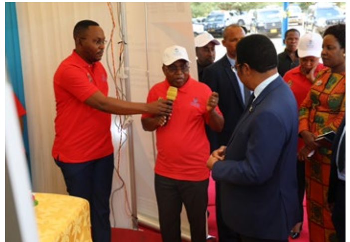
Waziri Mkuu, Mhe. Kassim Majaliwa akimsikiliza Waziri wa Katiba na Sheria Mhe. Dkt. Damas Ndumbaro wakati alipotembelea mabanda ya maonesho kabla ya kuzindua Kampeni ya Msaada wa Kisheria ya Mama Samia (Mama Samia Legal Aid Campaign) kwenye ukumbi wa Chuo Kikuu cha Dodoma, Aprili 27, 2023.