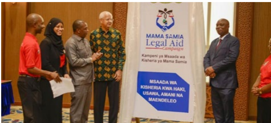
Mgeni Rasmi Mhe. Haroun Ali Suleiman, Waziri wa Nchi, Ofisi ya Rais Katiba, Sheria, Utumishi na Utawala Bora na meza kuu wakizindua rasmi Mama Samia Legal Aid Campaign Zanzibar.

Mama Samia Legal Aid Campaign inaendelea kutekelezwa katika maeneo mbalimbali nchini ambapo kwa mwezi huu wa Tano, Kampeni hii inahamia katika mkoa wa Shinyanga baada ya kukamilisha utekelezaji wake katika Mkoa wa Dodoma ilipozinduliwa Rasmi na Waziri Mkuu wa Jamhuri ya Muungano wa Tanzania Mhe. Kassim Majaliwa Majaliwa Aprili 27 mwaka huu.